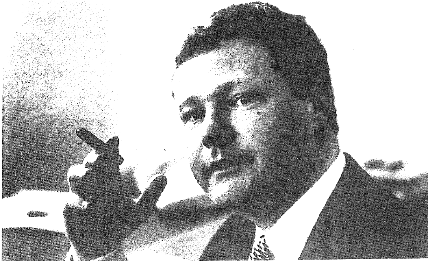
...geen commentaar op terugkeer uit Indonesië...